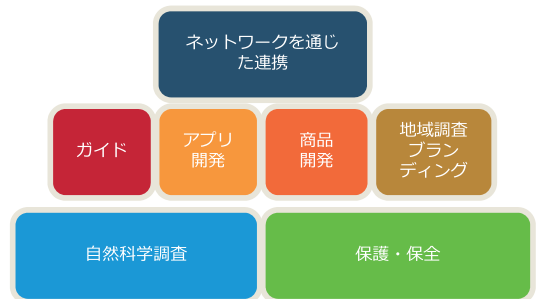
SDGsピラミッド (ジオパークで取り組まれている教育活動の例。下から上にかけて展開することでSDGsを構成)

各種の事業は、業界や組織全体を見通しながら展開されるべきですが、実際には縦割りの専門性の中で日々展開されています。ここに、「教育」という“色のついていない”中間的なアクターを介在させることで、双方の意思疎通のきっかけや、健全な広報の役割を持たせることができます。