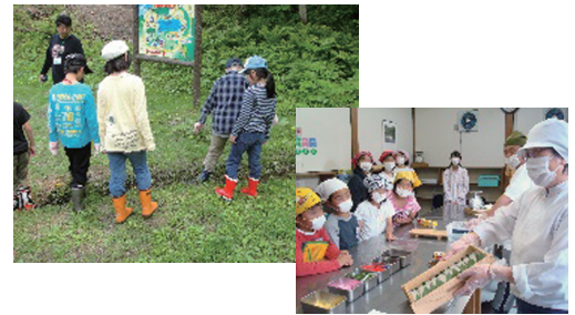
生産地と工場見学の総合コーディネート (イメージ)

生産・流通・消費という食にまつわる一連の流れをたどりながら、持続可能な地域社会づくり(SDGs)につながる体験型の教材および教育旅行を共同開発します。