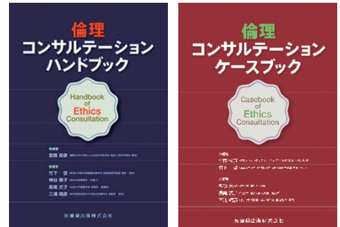
編集・執筆した倫理コンサルテーションに関する書籍

医療や福祉の領域において、患者・利用者や専門職は、しばしば困難な問題に直面します。こうした場合に、当事者の対話を促進し、問題の解決を支援する上で有効と考えられてきたのが「倫理コンサルテーション」です。しかし日本では、導入・運営のための方法・ノウハウが共有されずにいました。そこで、共同研究を通じて、海外の状況も踏まえつつ、日本での導入・運営に必要な知見を書籍として出版しました。現在は在宅医療において同様の活動を実現するために研究を行っています。