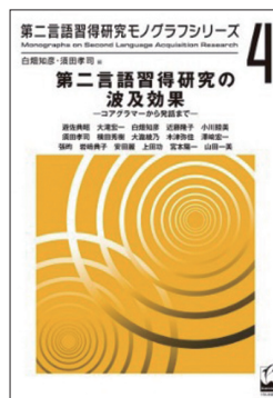
白畑知彦・近藤隆子・小川睦美・須田孝司・横田秀樹・大瀧綾乃(2020年) 日本語母語話者による英語非対格動詞の過剰受動化現象に関する考察 白畑知彦・須田孝司[編] 『第二言語習得研究モノグラフシリーズ 第二言語習得研究の波及効果』 くろしお出版