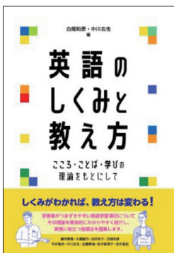
大瀧綾乃(2020年) 動詞の3区分の知識とその指導法 白畑知彦・中川右也[編] 『英語のしくみと教え方 このころ・ことば・学びの理論をもとにして』 くろしお出版

第二言語習得研究で得られた知見を基に、英語学習者が正しく英語(文法・語彙)を理解できるための効果的な英文法指導の内容と方法を開発しています。