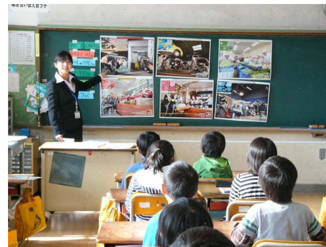
18 Shizuoka University