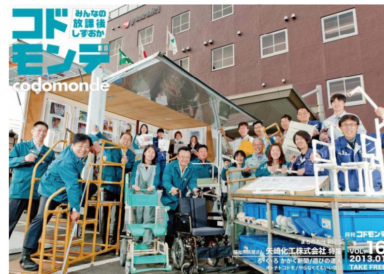
20 Shizuoka University