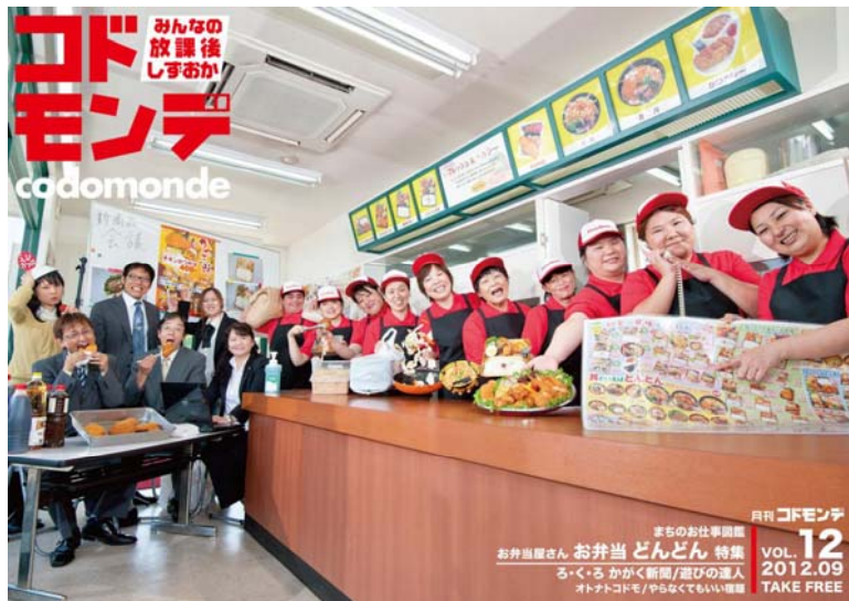
まちのお仕事図鑑 お弁当屋さん お弁当 どんとん 特集 VOL. 12 2012.09 TAKE FREE