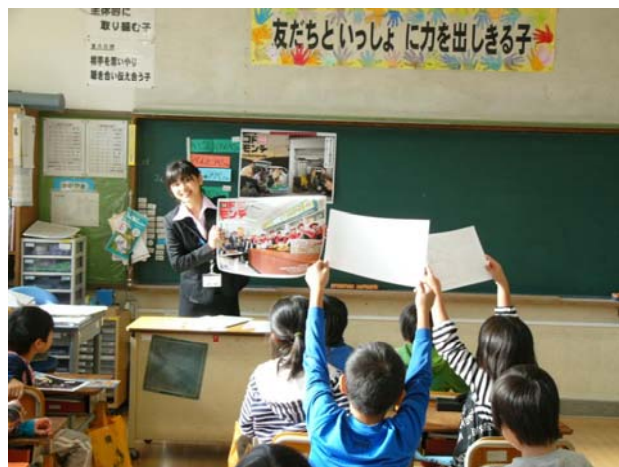
17 Shizuoka University