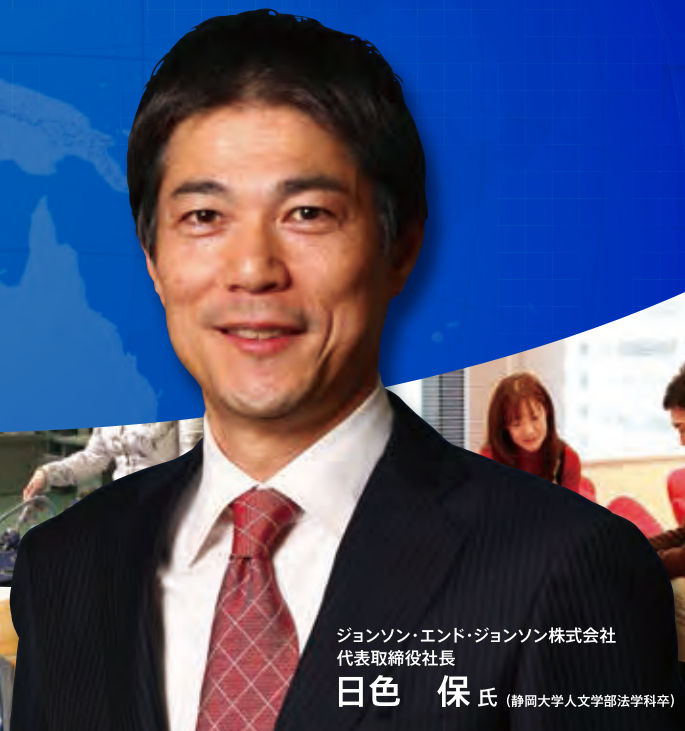
ジョンソン・エンド・ジョンソン株式会社 代表取締役社長