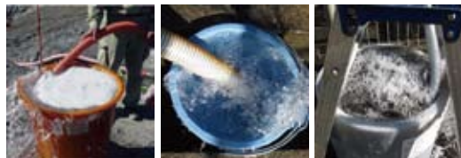
付加体の深部帯水層に由来する温泉付随ガス（メタン、70-99%）

我々は、温泉施設にて大気放散されている温泉付随ガスのメタンと温泉に含まれる微生物群集を利活用した“分散型エネルギー生産システム”の実用化を進めている。本エネルギー生産システムは、地下水・ガス・電気・熱を自家的に生産できる。よって、災害時の防災ステーションとしての役割を担うことも計画している。