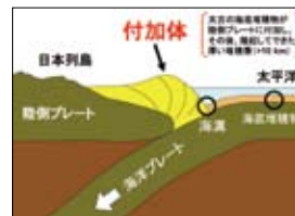
海洋プレートの沈み込みと付加体の地質構造