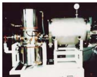
図2 JxB ナノチューブ、微粒子、フラーレン連続合成装置。