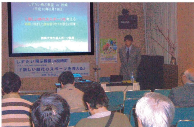
「飛ぶ教室 in 松崎町」の講演風景

町内スポーツ関係団体の方、教育委員会職員、スポーツ愛好者等30名の参加がありました。