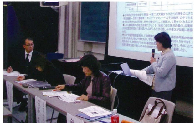
学習ネットワークと生涯学習⑧事例報告風景

日 時：平成18年1月31日（火）14:25～16:00 場 所：静岡キャンパス共通教育A棟301室 (趣旨) 情報ネットワークを活用した教育実践、大学と企業の連携によるキャリア教育の取り組みなどから学習ネットワークの拠点として大学の再構築を検討する。