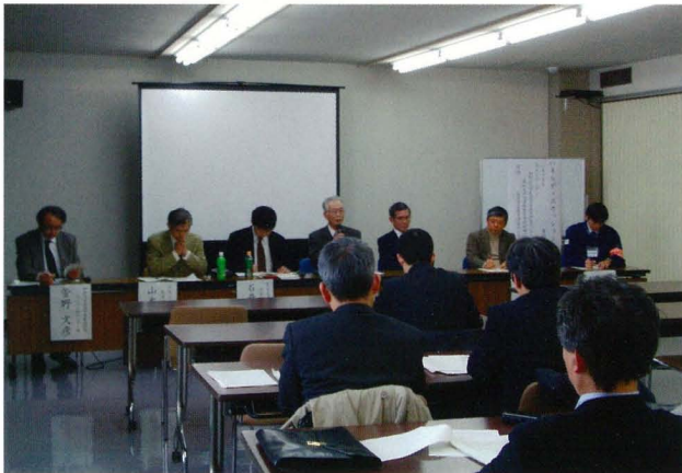
生涯学習指導者研究事業 パネルディスカッション風景