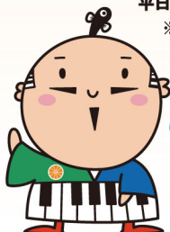
出世大名 家康くん ©浜松市

駐車場に限りがありますので、事前申込時に駐車場利用の旨を申し出てください。当日、正門にて警備員の指示に従い駐車してください。公共交通機関の利用にご協力をお願いします。