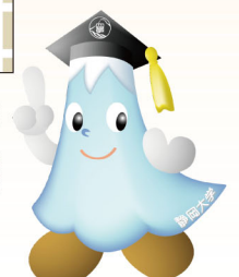
静岡大学キャラクターしずっぴー

主催/静岡大学グリーン科学技術研究所 共催/浜松市、(公財)浜松市文化振興財団 問い合わせ/浜松科学館 E-mail:kagakukan@hcf.or.jp