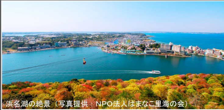
浜名湖の絶景